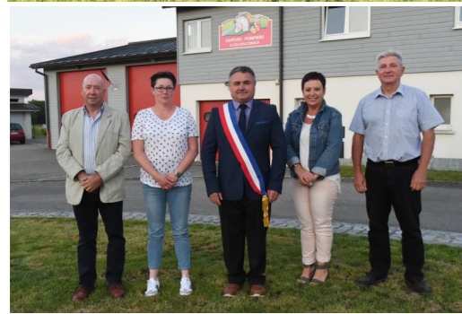
En haut, le conseil municipal au complet ; en bas, le maire entouré de ses adjoints