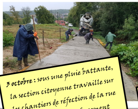
3 octobre : sous une pluie battante, la section citoyenne travaille sur les chantiers de réfection de la rue des Vignes et de renforcement du mur de clôture derrière l'école élémentaire.