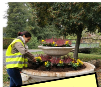
17 octobre : comme pour ses « plantations de printemps » du 16 mai, Flore et Loisirs a organisé ses « plantations d'automne » dans le respect des mesures de distanciation physique.