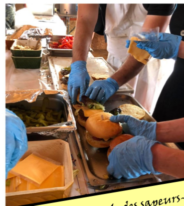
4 juillet : L'Amicale des sapeurs-pompiers propose des burgers maison – gros succès auprès des habitants !

... c'est aussi cela : quelques images de 2020