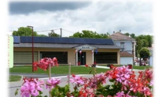
Ci-dessus, la mairie avec, à l'arrière-plan, l'ancienne école élémentaire

Le bâtiment est situé au cœur du village, à quelques pas de la nouvelle mairie, avec des places de stationnement à proximité. Les détails du dossier technique sont disponibles dans la présentation publiée sur Internet à l'adresse www.soppe-le-bas.fr/medisoppe .