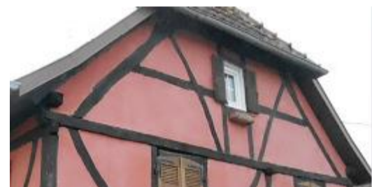
Combles à surcroît Kniestock